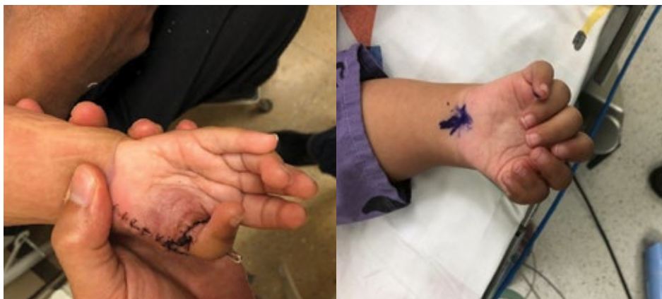
כך נראית "כף יד ראי" לפני התיקון (מימין) ולאחריו (משמאל)

גילתה שלא מדובר במקרה סטנדרטי של אצבעות עודפות, אלא ב"יד ראי" קלאסית עם שכפול של האצבעות וגם של האמה. הוריו ציינו שההיריון היה תקין, ושבסקירות לא נתגלו מומים כלשהם. לאחר הלידה, הילד עבר בירור מקיף והתגלה שהוא בריא לחלוטין לבד מהמום ביד. הוריו היו מעוניינים בשיפור מראה היד וכן ביצירת אגודל תפקודי, כיוון שהוא התקשה מאוד באחיזה יעילה. כשהתינוק היה בן שנה ושלושה חודשים, ביצענו ביחידת כף היד פרוצדורה כירורגית מורכבת לכריתת האצבעות העודפות וליצירת אגודל מאחת האצבעות הנותרות (Pollicization). מדובר בהליך רפואי מסובך, הן בשל גודל המבנים הקטן והן בגלל האנטומיה הייחודית במום זה, שאינה דומה לאנטומיה הרגילה של כף היד. במקרים כאלו, קיים חשש סביר שבשל המבנה האנטומי הייחודי ייפגעו כלי הדם הזעירים המתחברים לאצבע שעתידי להיות האגודל, והאצבע תעבור נמק. בניתוח, שארך כארבע שעות, הוסרו אצבעות עודפות ואצבע נוספת קוצרה וסובבה ליצירת האגודל. בסיום הניתוח התוצאה הקוסמטית הייתה משביעת רצון, והאגודל החדש היה חיוני וללא סימני נמק. הילד החל בתהליך שיקומי ממושך, המלווה על ידי צוות מהיחידה לריפוי בעיסוק, ונמצא במעקב מרפאתי צמוד במרפאת כף יד במחלקה האורתופדית במרכז שניידר.