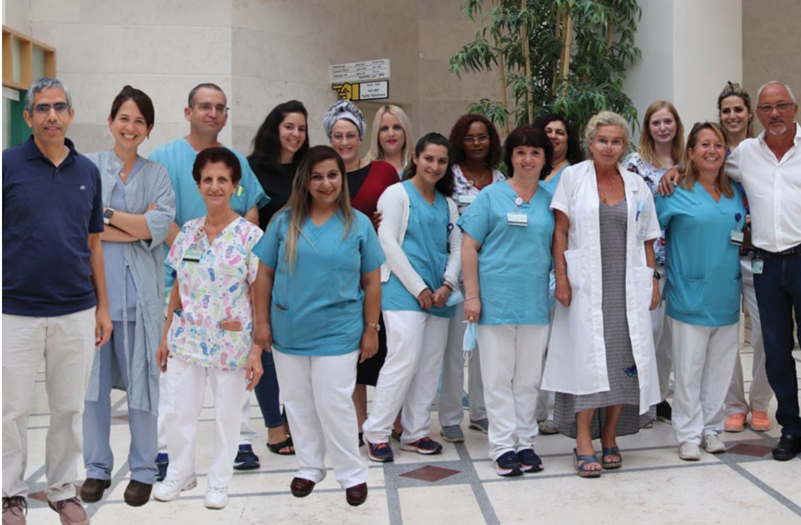
צוות המחלקה לכירורגיה במרכז שניידר